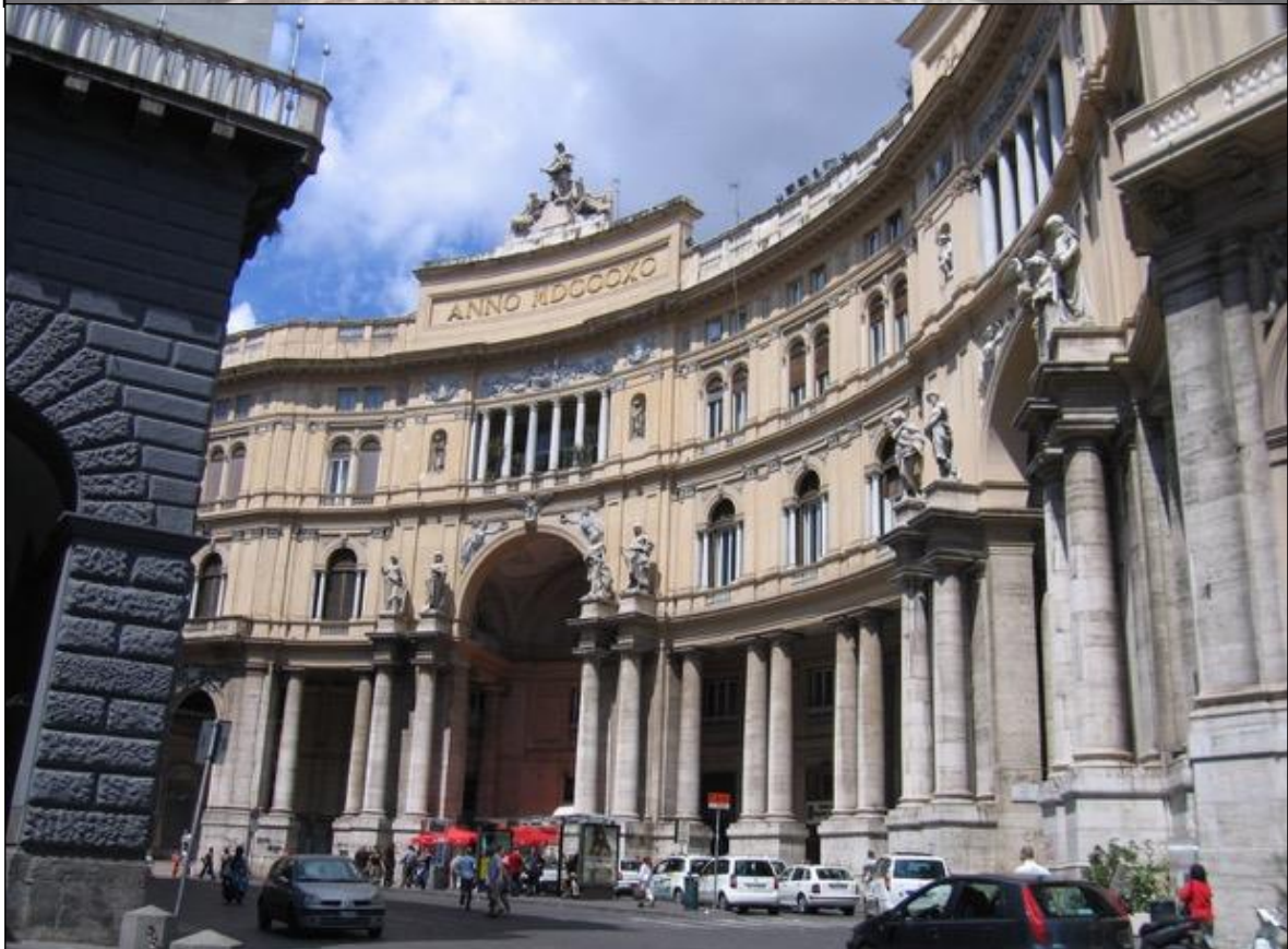
Angioino e si entra in Palazzo Reale. Visitiamo gli appartamenti, lungo percorso,