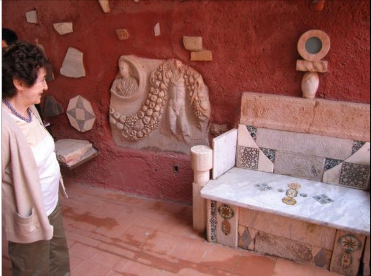
La villa è bella e stupendo è il giardino. Da tutte le parte pezzi antichi di marmo e pietre